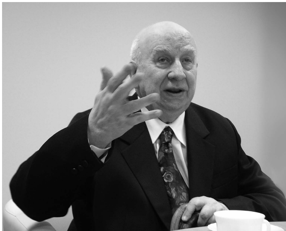
PROFESOR MIECZYŚLAW GOGACZ (1926 – 2022)